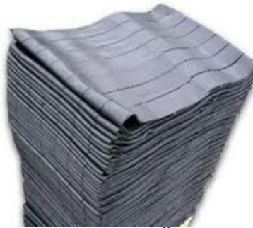
Şerit Hamur Örneği

3.2. Gelen kauçuk hamurlar 57mm genişliğinde 8mm kalınlığında şerit halinde kesilmiş olarak gelmelidir.